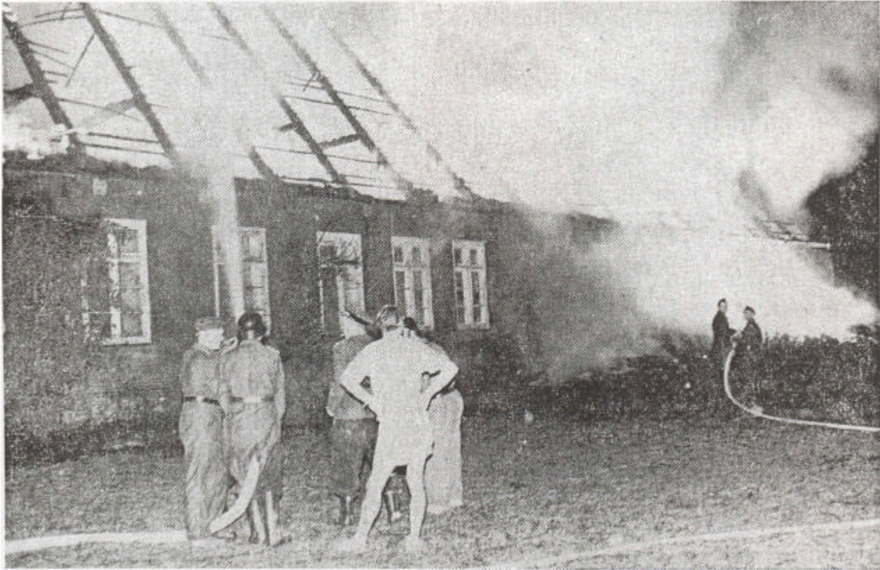
Hoch schlugen die Flammen aus dem Mohrhof in Osterbelmhusen. Keine Rettung mehr für das Wohn- und Wirtschaftsgebäude. Nur wenig Hausrat konnte aus den verwüsteten Zimmern geborgen werden.